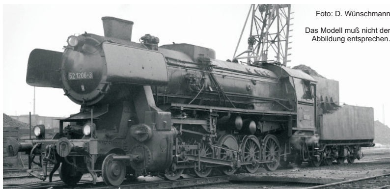
Das Modell muß nicht der Abbildung entsprechen.

52300 Dampflokomotive BR 52 der DR mit Steifrahmentender