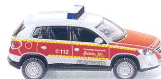
0601 19 37 Feuerwehr Herborn – VW Tiguan