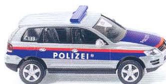
0104 42 38 Bundespolizei – VW Touareg