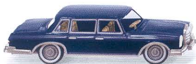
0156 02 32 MB 600