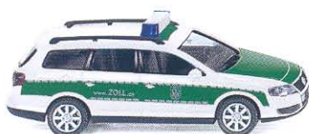
0104 41 36 Zoll – VW Passat Variant