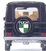
0266 40 29 Puch G