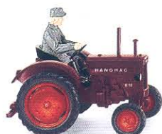
0885 03 32 Hannomag R 16