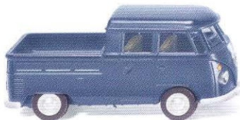
0789 01 30 VW T1 Doppelkabine