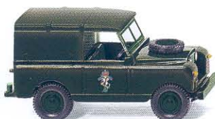
0100 01 32 Land Rover Brigade Berlin